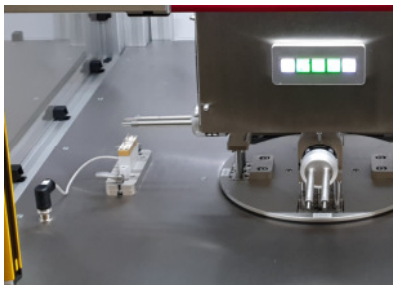
Be-/Entladestation für bis zu 2 Spulen, Durchgangsprüfstation

Als Maschinenbauer bieten wir kundenspezifische Lösungen. Wir haben das Know-How und die technische Ausstattung, um Ihre Anforderungen schnell umzusetzen.